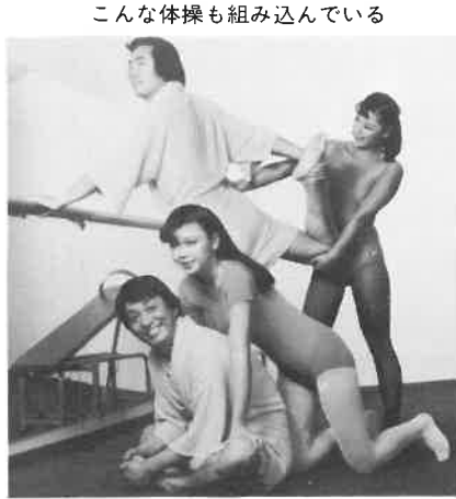
こんな体操も組み込んでいる