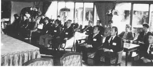
関西サウナ協会新年互礼会出席の皆さん

肩書が那覇東急ホテル代表取締役は、那覇東急ホテルサウナ代表取締役の誤りでした。訂正させていただきます。