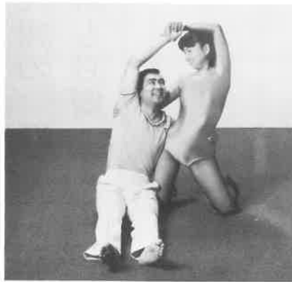
2人で楽しくのびのび体操

店舗であるばかりでなく、駅前前立地としては初めてのケース。それだけに固定客が少なく、どうしても、お客様の固定化と、駅前立地を有利に生かす必要がある。 そこで「女のやさしさに男のやすらぎ」をどう演出するか、大和