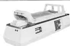
ROLLING HIGH-CROWN ローリング・ハイクラウン

「温熱装置」「酵素加湿装置」「赤外線輻射装置」などの機能を持つ全身複合温熱装置です。美容、健康管理などに高い効果を発揮し、従来の熱気浴槽に比べ省スペース型となっていますし、電気消費量も \frac{1}{2} と省エネ設計です。