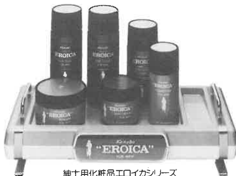
紳士用化粧品エロイカシリーズ

エロイカのあの独特の清涼感とまろやかさ、心にゆとりを生む気品ある香り。英雄は英雄を知るとカ。エロイカは、おたくのサウナに一級のお客さまを呼ぶでしょう。