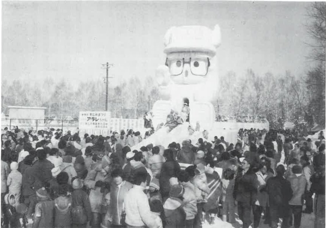
アラレちゃんの氷雪像に人気